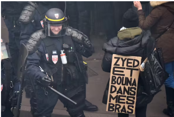
Pancarte au nom de Zyed et Bouna lors d'une manifestation en soutien à Théo (2017).